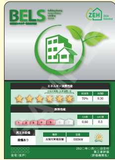
B5, B6, A6 サイズ