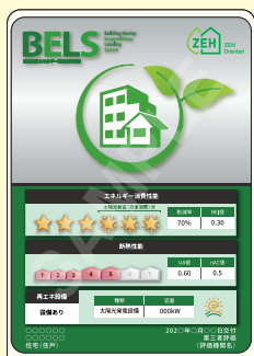
B5, B6, A6 サイズ