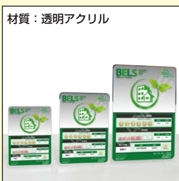
材質：透明アクリル

A6 本体：W105×H148 表示面：W105×H148 15,400円(14,000 1,400)