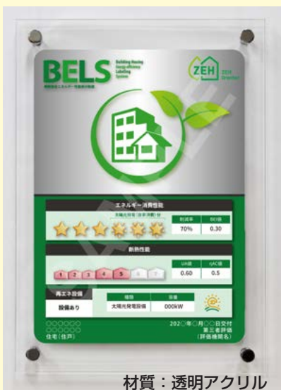
材質：透明アクリル